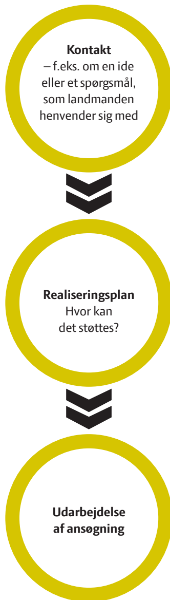
Figur 1: Traditionelt landdistriktsrådgivningsforløb

Sagt på en anden måde er formålet med afdækningen at besvare spørgsmålene: Hvad er det personlige udgangspunkt for landmanden? Hvad vil han/hun dybest set med sit projekt, sin bedrift, sit lokalområde? Hvilke ressourcer og muligheder kan man